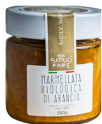
MARMELLATA ALL'ARANCIA 250 gr 4 €

Cooperativa agricola sociale "Si può fare"