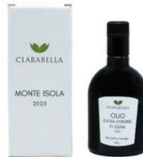
OLIO EXTRAVERGINE DI OLIVA "MONTEISOLA" 0,50 lt 17,50 €