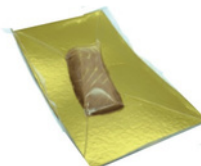
FILETTO DI STORIONE AFFUMICATO A FREDDO