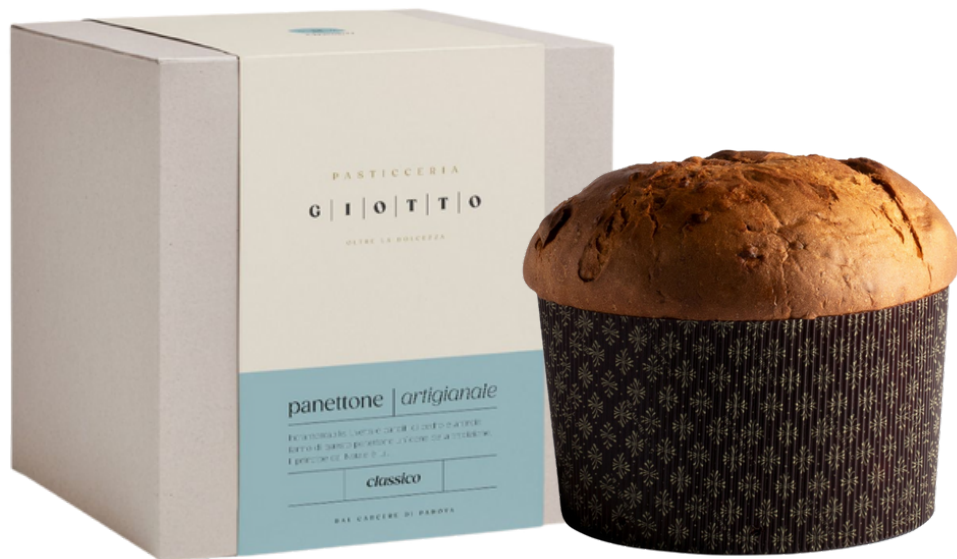
Panettone classico artigianale Giotto dal Carcere di Padova 750 gr 20 €