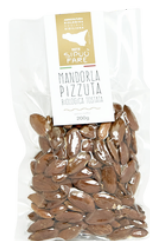
MANDORLE PIZZUTE BIOLOGICHE TOSTATE 200 gr 8,50 €