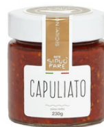
CAPULIATO DI POMODORO CILIEGINO 230 gr 6 €