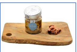
2 Vasi di Pronto Pasta in olio extravergine di oliva