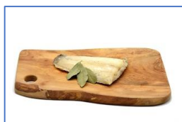
1 Filetto Luccio affumicato a caldo