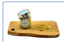
1 Vaso di Brodo di Lago in polvere