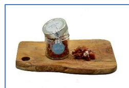
2 Vasi di Briciole di Lago essiccate

AGROITTICA CLARABELLA - Centro di trasformazione ittica - CLARABELLA Società Cooperativa Sociale Agricola Onlus Sede Legale: Via delle Polle, n° 1800 - 25049 - ISEO (BS) Sede Impianto: Via Cremignane, n° 12b - 25049 - ISEO (BS) PER ORDINI: Telefonare a +39 - 030.2385924 o inviare una e-mail a: info@agroitticaclarabella.it WEB: www.agroitticaclarabella.it Facebook: Agroittica Clarabella Instagram: @agroitticaclarabella