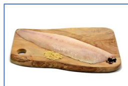
1 Filetto di Salmerino affumicato a freddo