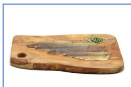
1 Confezione di Agoni filetto affumicati a freddo