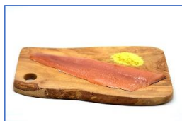
1 Filetto di Trota iridea salmonata affumicato a freddo