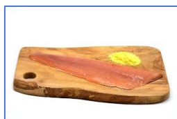
2 Filetti di Trota iridea salmonata affumicato a freddo