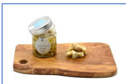
1 Vaso di Tocchetti di Luccio in olio extravergine di oliva