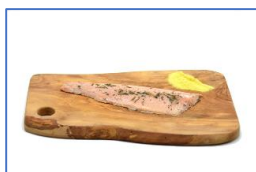
1 Filetto di Trota iridea salmonata affumicato a caldo