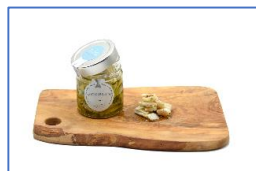
1 Vaso di Tocchetti di Lucioperca in olio extravergine di oliva