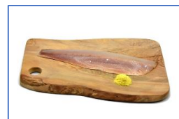
1 Filetto di coregone affumicato a freddo