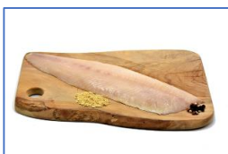
2 Filetti di Salmerino affumicato a freddo