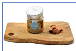
1 Vaso di Pronto Pasta in olio extravergine di oliva